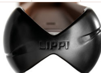
Bouchon du poteau EXPERT (260S)