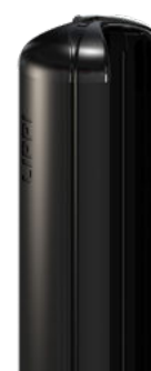
Profil du poteau EXPERT (260S)

RETROUVEZ TOUS LES COLORIS DISPONIBLES DANS LE CATALOGUE TECHNIQUE