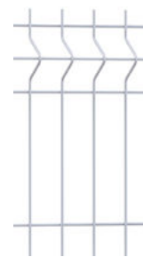
Maille du panneau EXPERT 55 Medium

Nous déclinons toute responsabilité si des pare-vues sont installés sur nos clôtures.